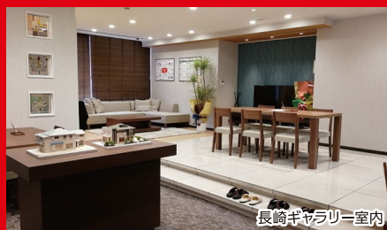
長崎ギャラリー室内