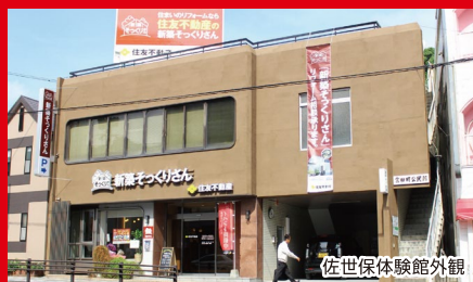
佐世保体験館外観