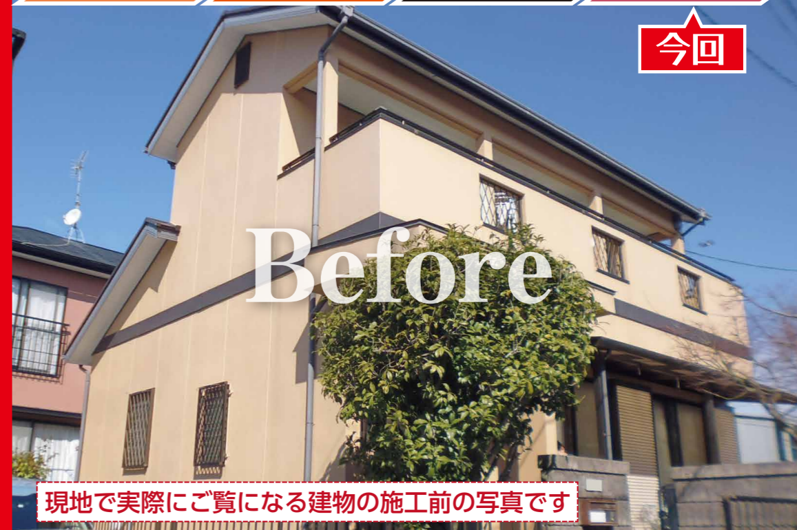
現地で実際にご覧になる建物の施工前の写真です