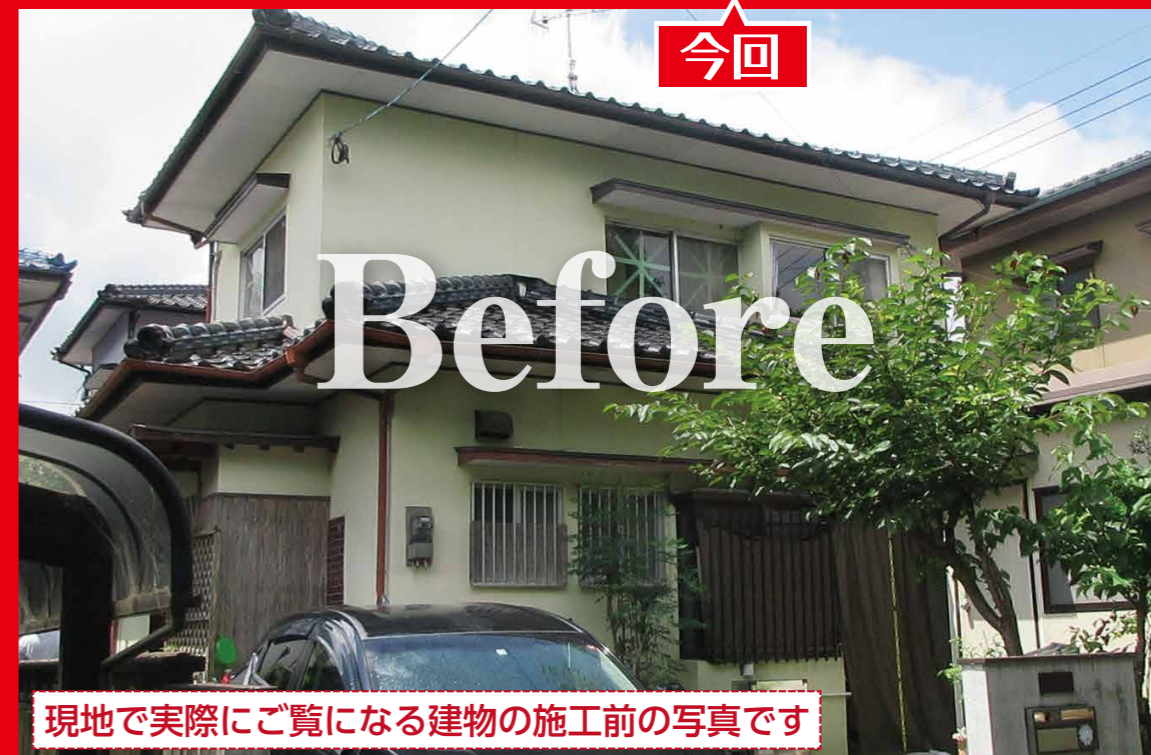
現地で実際にご覧になる建物の施工前の写真です