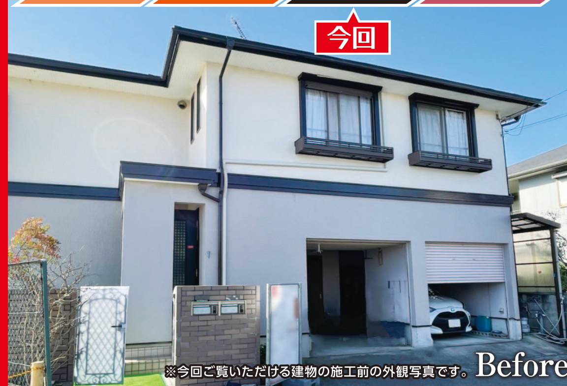
※今回ご覧いただける建物の施工前の外観写真です。Before