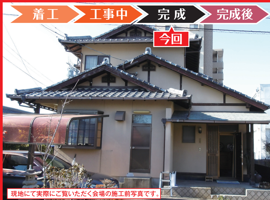
現地にて実際にご覧いただく会場の施工前写真です。