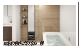
※バスルームイメージ