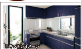
※キッチンイメージ