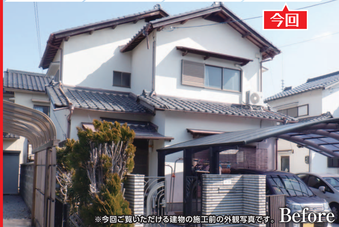
※今回ご覧いただける建物の施工前の外観写真です。Before