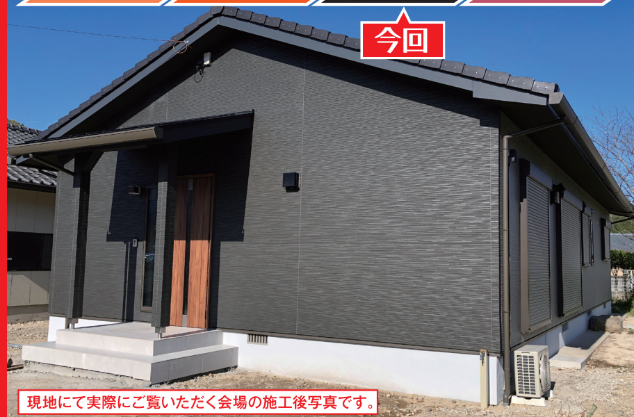
現地にて実際にご覧いただく会場の施工後写真です。