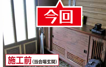
施工前 (当会場玄関)