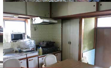
施工前 (当会場キッチン)