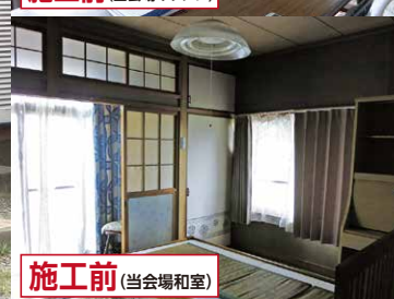
施工前 (当会場和室)