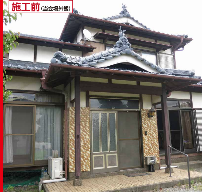
施工前 (当会場外観)