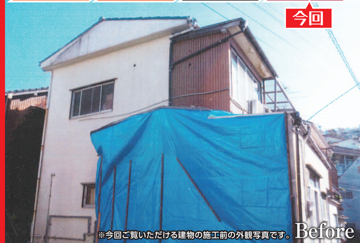
※今回ご覧いただける建物の施工前の外観写真です。 Before