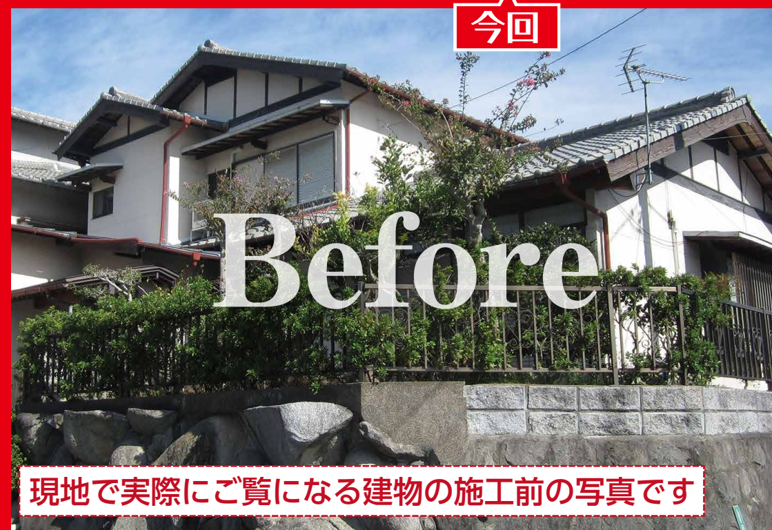
現地で実際にご覧になる建物の施工前の写真です