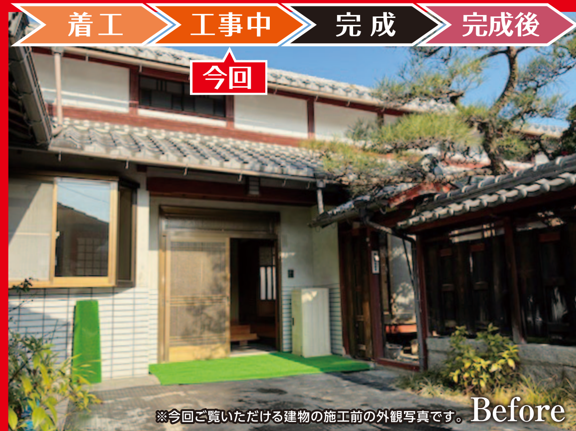
※今回ご覧いただける建物の施工前の外観写真です。Before