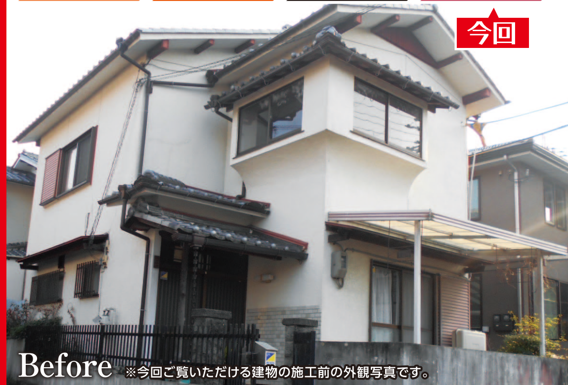
Before ※今回ご覧いただける建物の施工前の外観写真です。