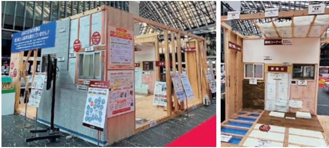
※地盤調査、アスベストのサンプリング分析調査は有料となります。