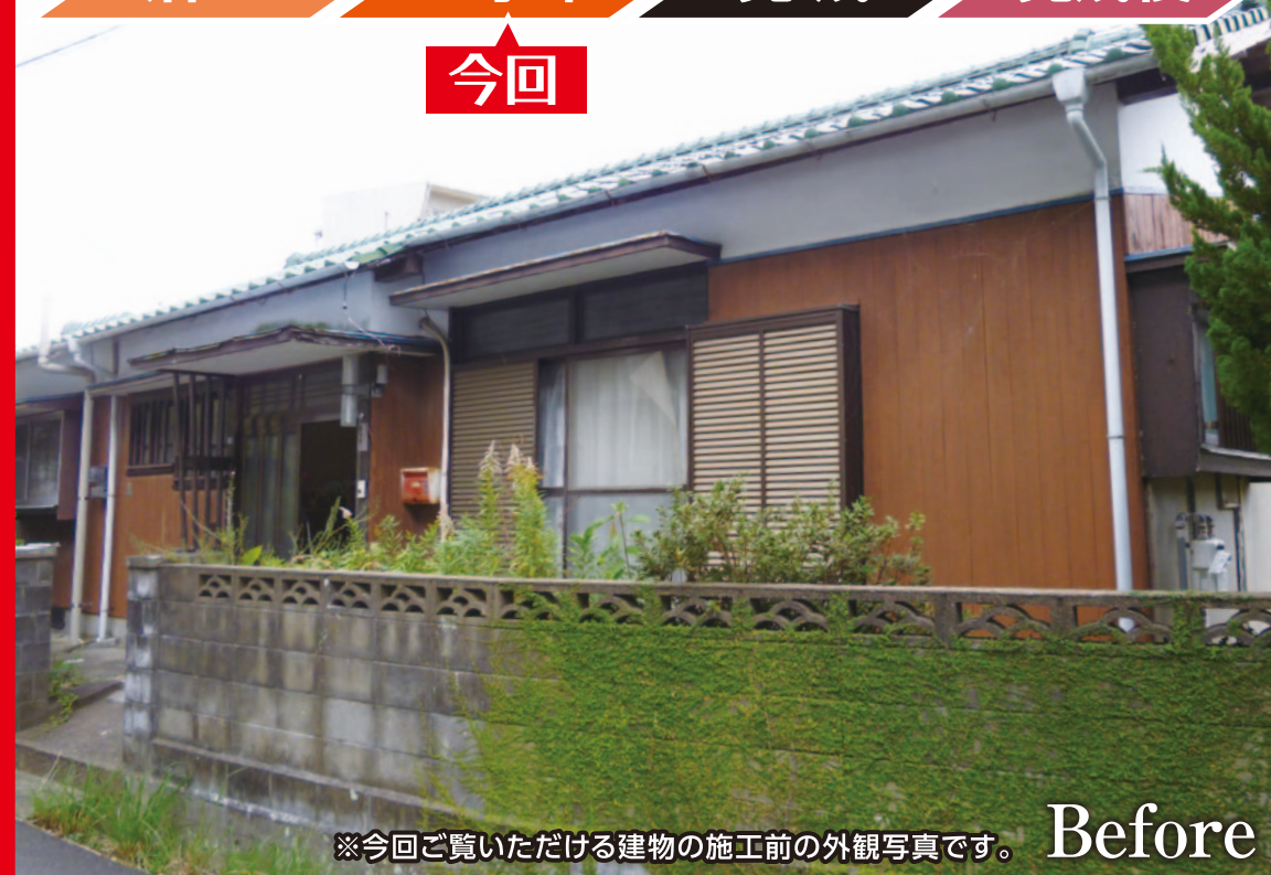
※今回ご覧いただける建物の施工前の外観写真です。 Before