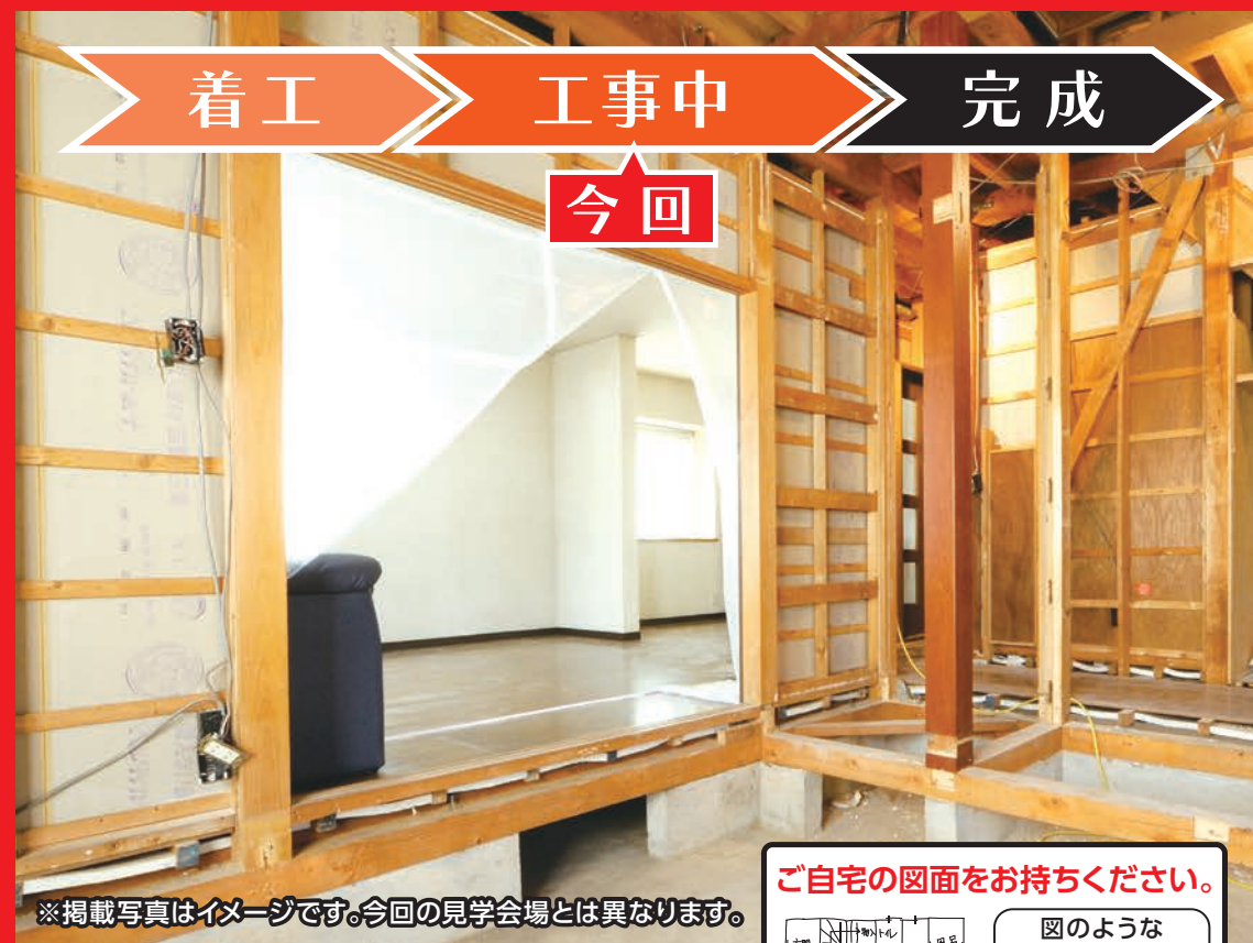
※掲載写真はイメージです。今回の見学会場とは異なります。