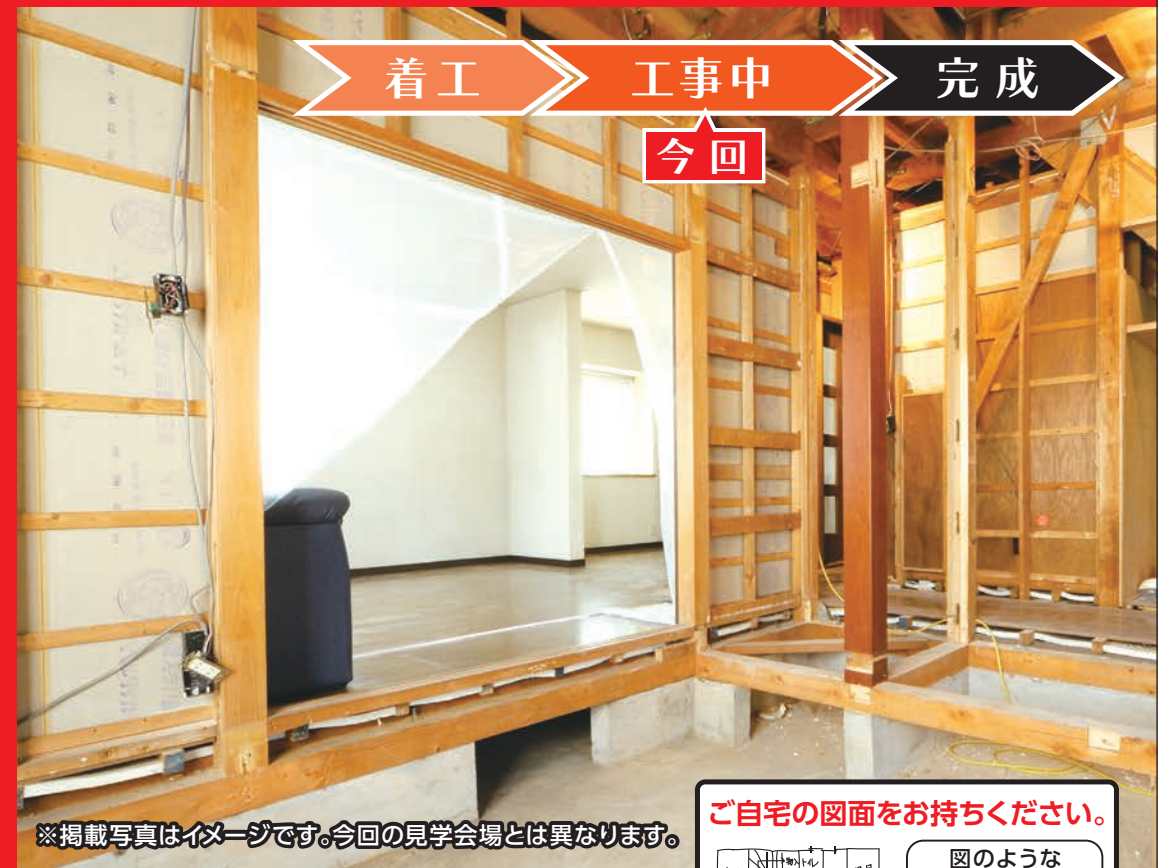
※掲載写真はイメージです。今回の見学会場とは異なります。

間取り変更に伴う構造体の補強や、 工事中にしか見られない 貴重な内側を新築そっくりさんで ぜひご覧ください！