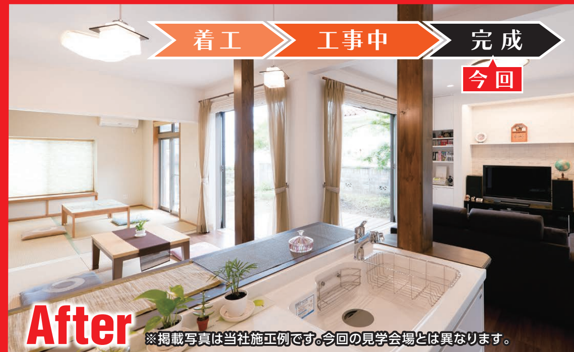
※掲載写真は当社施工例です。今回の見学会場とは異なります。