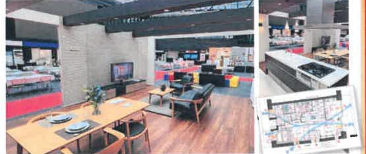
※分譲竣工時のデータの有無によって印刷出力できない場合がございます。※間取図はイメージ