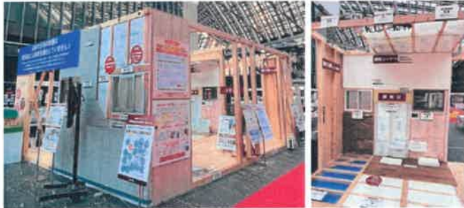
※地盤調査、アスベストのサンプリング分析調査は有料となります。