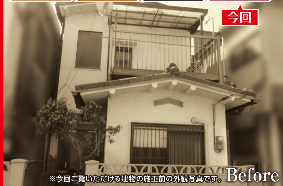
※今回ご覧いただける建物の施工前の外観写真です。Before