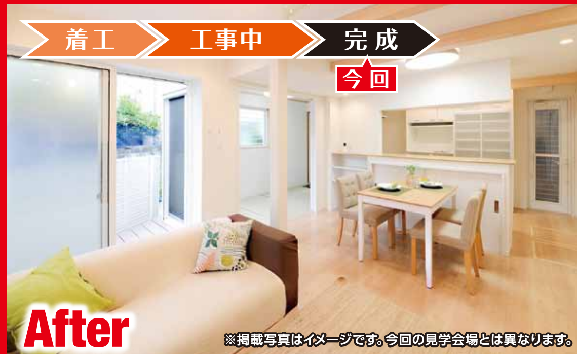
※掲載写真はイメージです。今回の見学会場とは異なります。