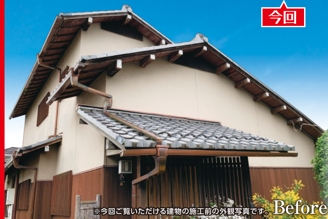
※今回ご覧いただける建物の施工前の外観写真です。Before