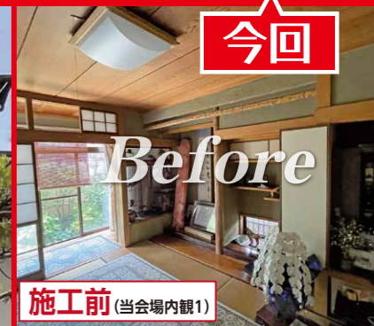
施工前 (当会場内観1)