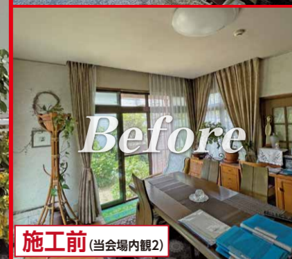
施工前 (当会場内観2)