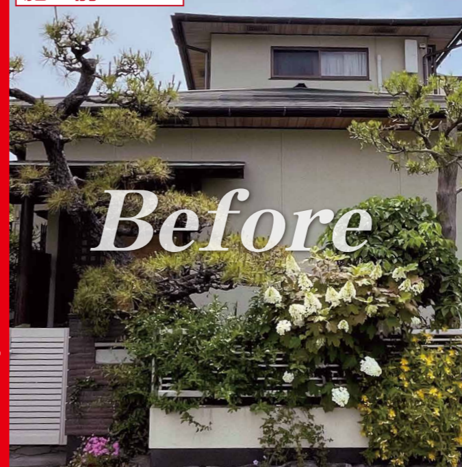
施工前 (当会場外観)