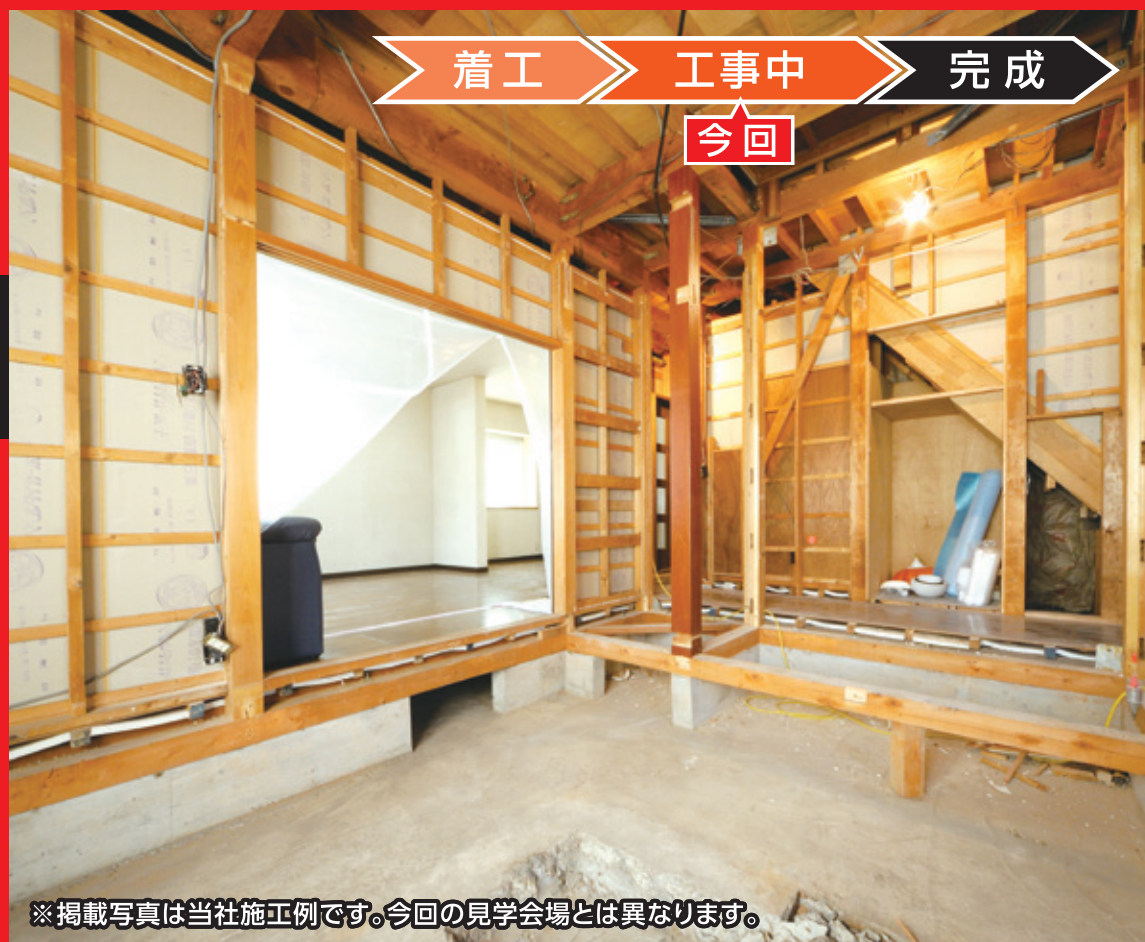
※掲載写真は当社施工例です。今回の見学会場とは異なります。