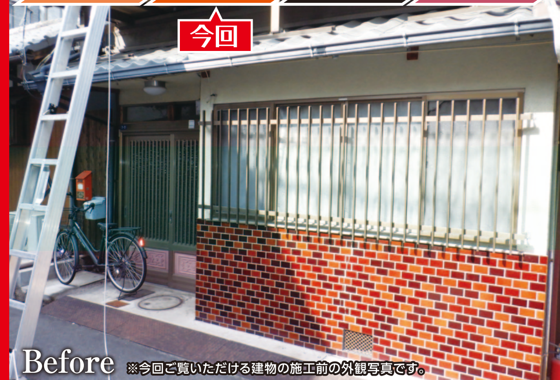
Before ※今回ご覧いただける建物の施工前の外観写真です。