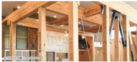
※写真は川越ショールームです。