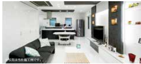
※写真は当社施工例です。

お問い合わせ/住友不動産 新築そっくりさん川越新座営業所 ☎0120-093-418 (電話受付時間/9:00~18:00)