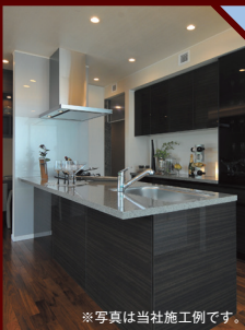
※写真は当社施工例です。