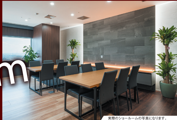
実際のショールームの写真になります。

住友不動産の「新築そっくりさん」では、水廻りなど部分的なリフォームから、大規模リフォームまであらゆる住まいのご相談を承ります! 既存建物の調査、耐震診断、プランご提案、お見積まで全て無料*! リフォームのプロに、住まいのお悩みをご相談ください。