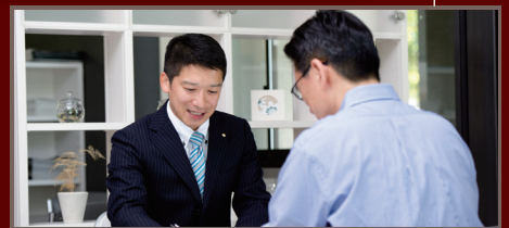
住まいづくりのプロと話す