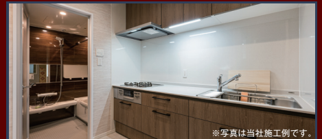
※写真は当社施工例です。