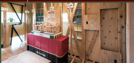
リフォームの流れや実例をご紹介します