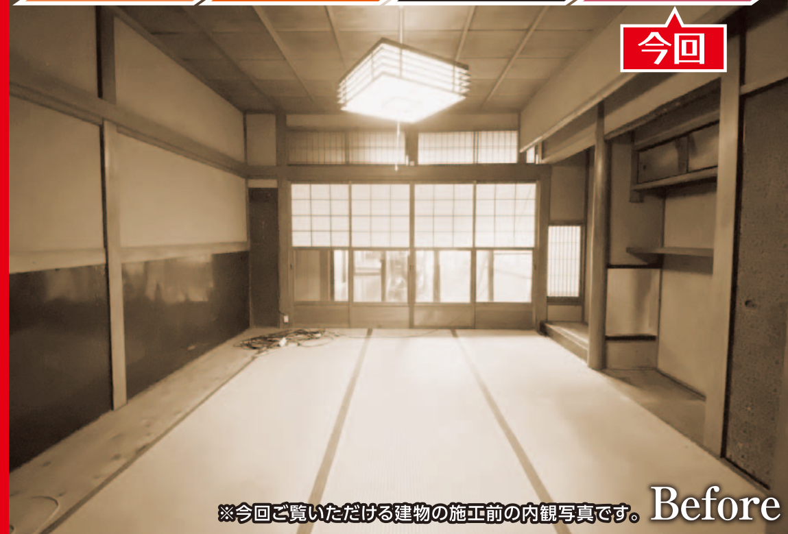
※今回ご覧いただける建物の施工前の内観写真です。 Before