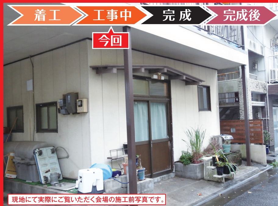
現地にて実際にご覧いただく会場の施工前写真です。