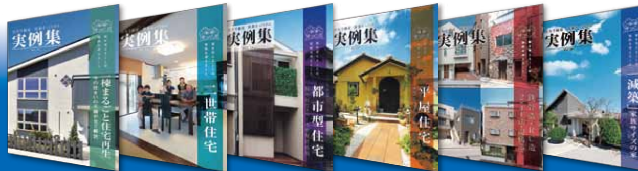
1棟まるごと住宅再生編 二世帯住宅編 都市型住宅編 平屋住宅編 鉄骨・RC造 2x4工法・混構造編 減築編