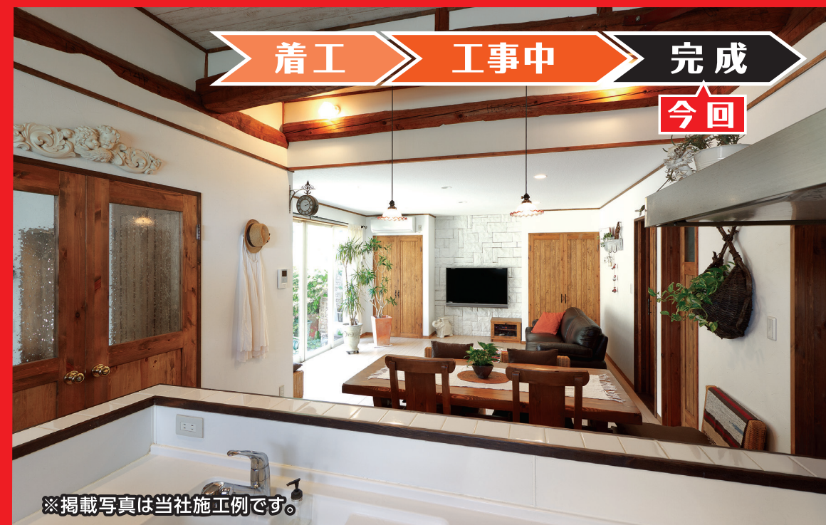
※掲載写真は当社施工例です。