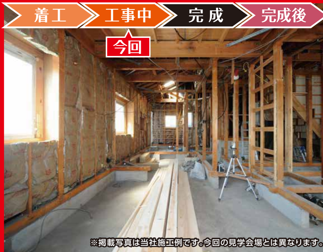
※掲載写真は当社施工例です。今回の見学会場とは異なります。