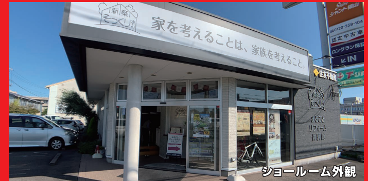
ショールーム外観