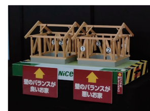
■実物大耐震補強模型

新築そっくりさんが誕生して四半世紀以上。震度6以上の大地震を幾度も経験しましたが、全壊・半壊した建物はなんと0件!(*)