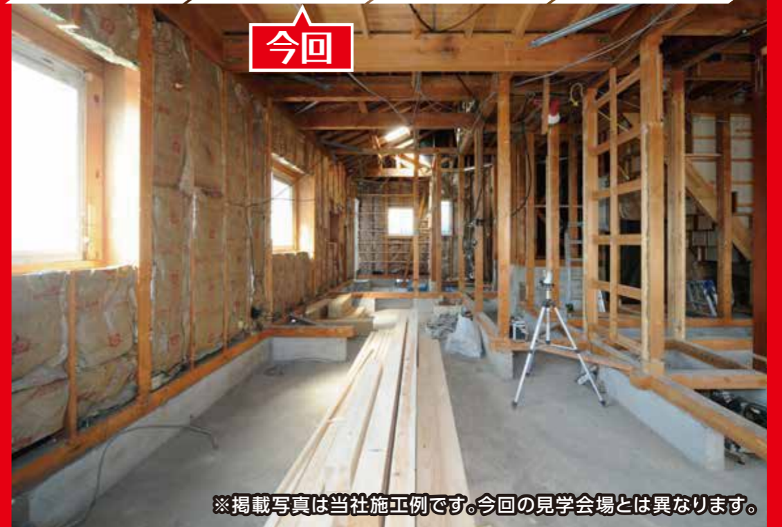
※掲載写真は当社施工例です。今回の見学会場とは異なります。