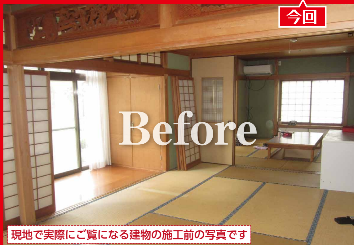
現地で実際にご覧になる建物の施工前の写真です