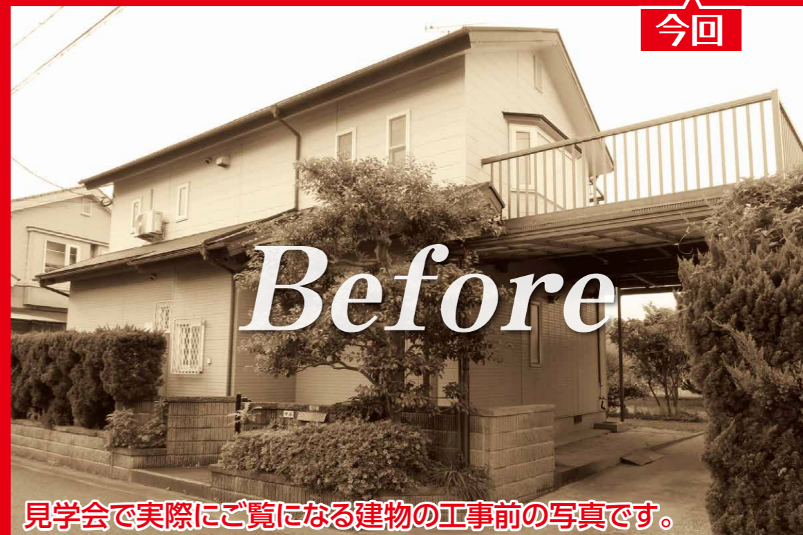
見学会で実際にご覧になる建物の工事前の写真です。