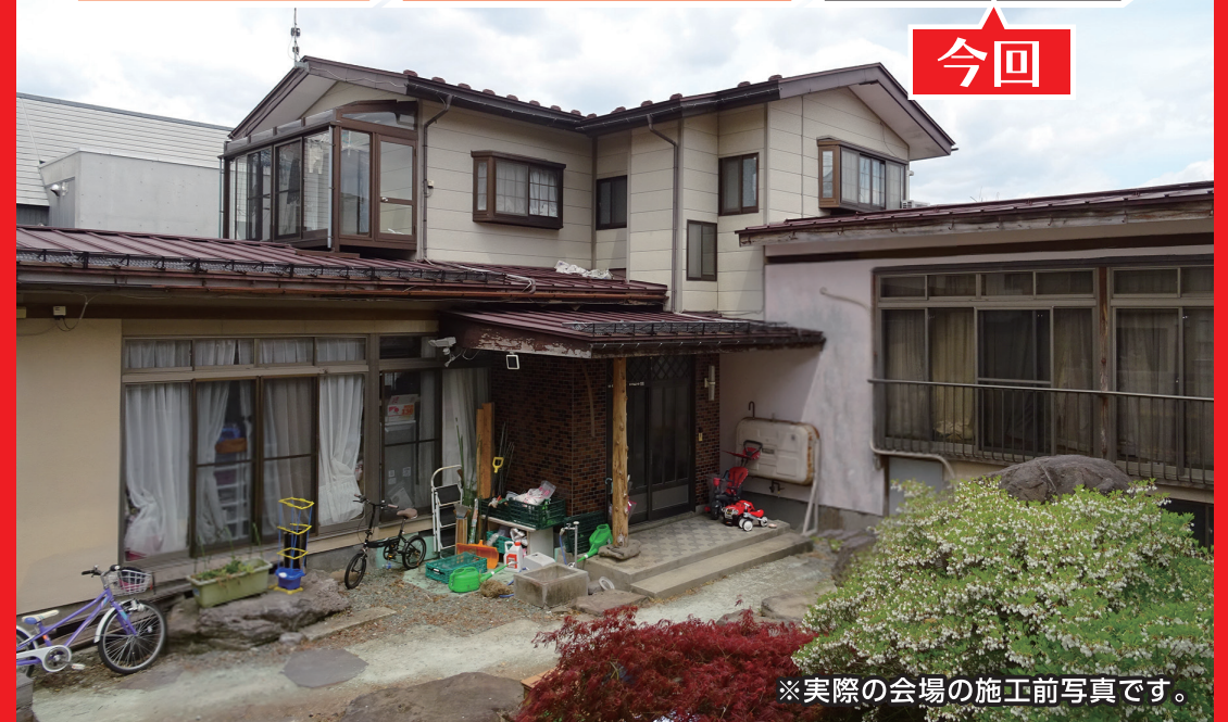
※実際の会場の施工前写真です。