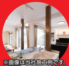
※画像は当社施工例です。