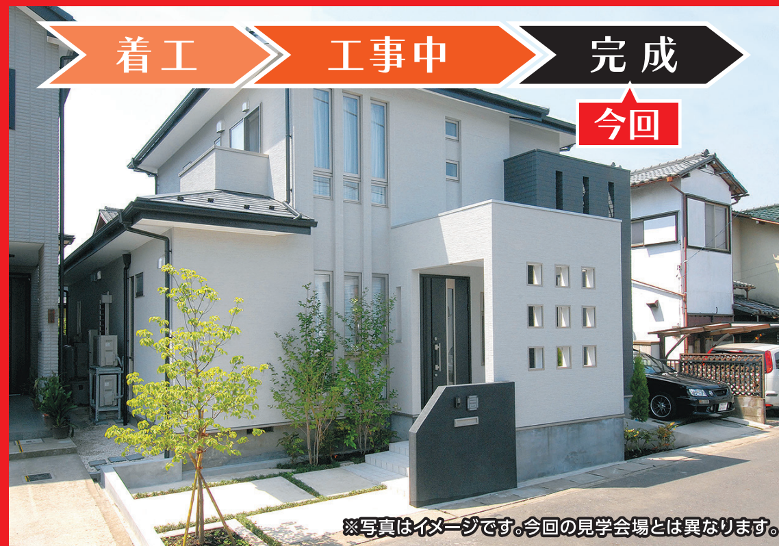
※写真はイメージです。今回の見学会場とは異なります。