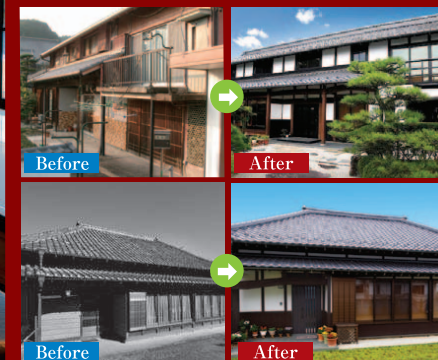
写真は全て弊社施工事例です。

住まいが古くなったからといって、すぐに建て替える必要はありません。基礎や柱など、建物を支える構造体はまだ十分に現役なのです。住友不動産の「新築そっくりさん」は基礎や柱をそのまま活かした「建て替えに代わる新システム」です。「新築そっくりさん」が現在のお住まいを美しく強い家に甦らせます。