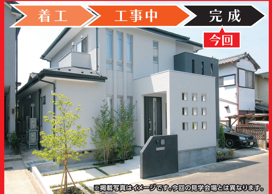
※掲載写真はイメージです。今回の見学会場とは異なります。