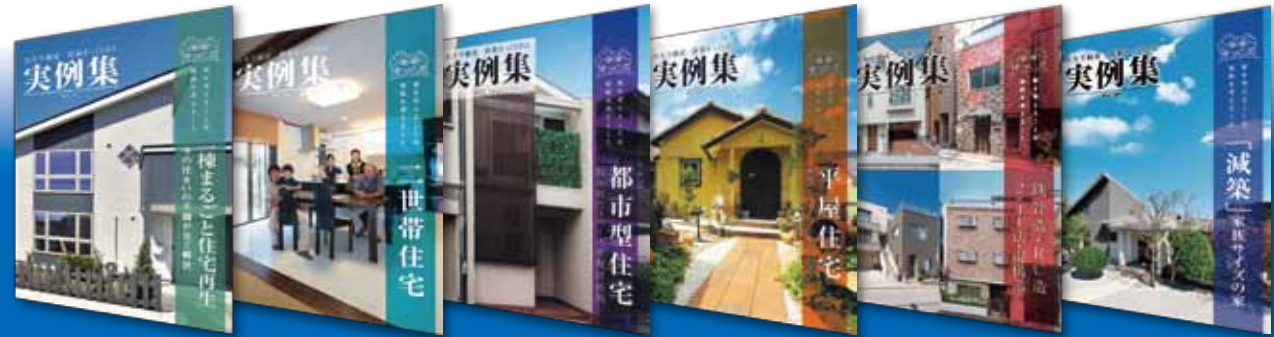
1棟まるごと住宅再生編 二世帯住宅編 都市型住宅編 平屋住宅編 鉄骨・RC造 2x4工法・混構造編 減築編