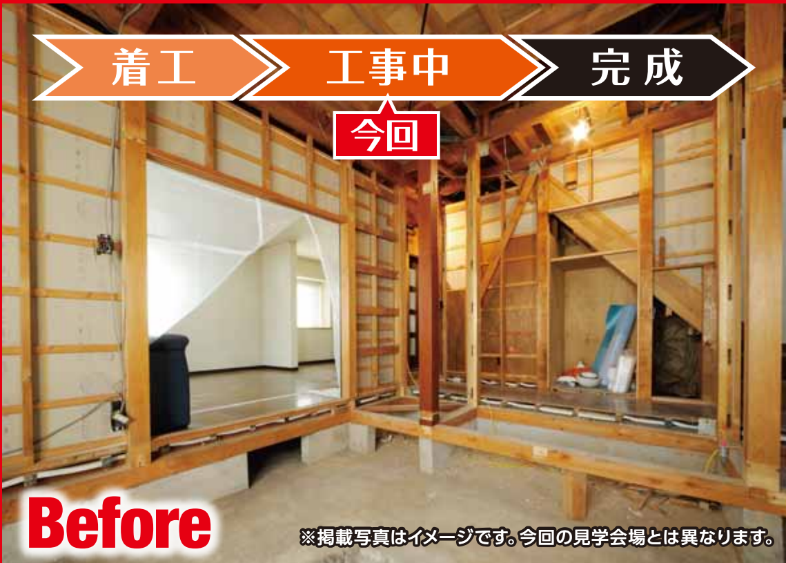
※掲載写真はイメージです。今回の見学会場とは異なります。

当日、ご自宅の図面をお持ちの方 その場でリフォームプランを作成!! ※建物の構造・規模によっては、 数日間お時間を頂戴いたします。 ※具体的なリフォームプラン・お見積りには、 建物調査が必要です。 ※掲載写真はイメージです。