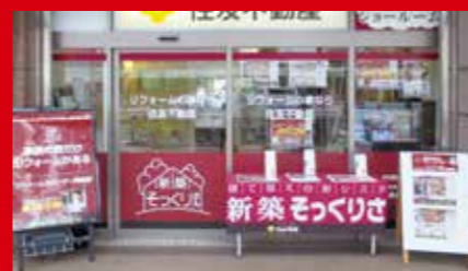
リフォームカウンター阿倍野

※内容や開催時間等が、予告なく変更になる場合がございます。予めご了承ください。※上記日時でご都合のつかない場合でもお気軽にご相談ください。