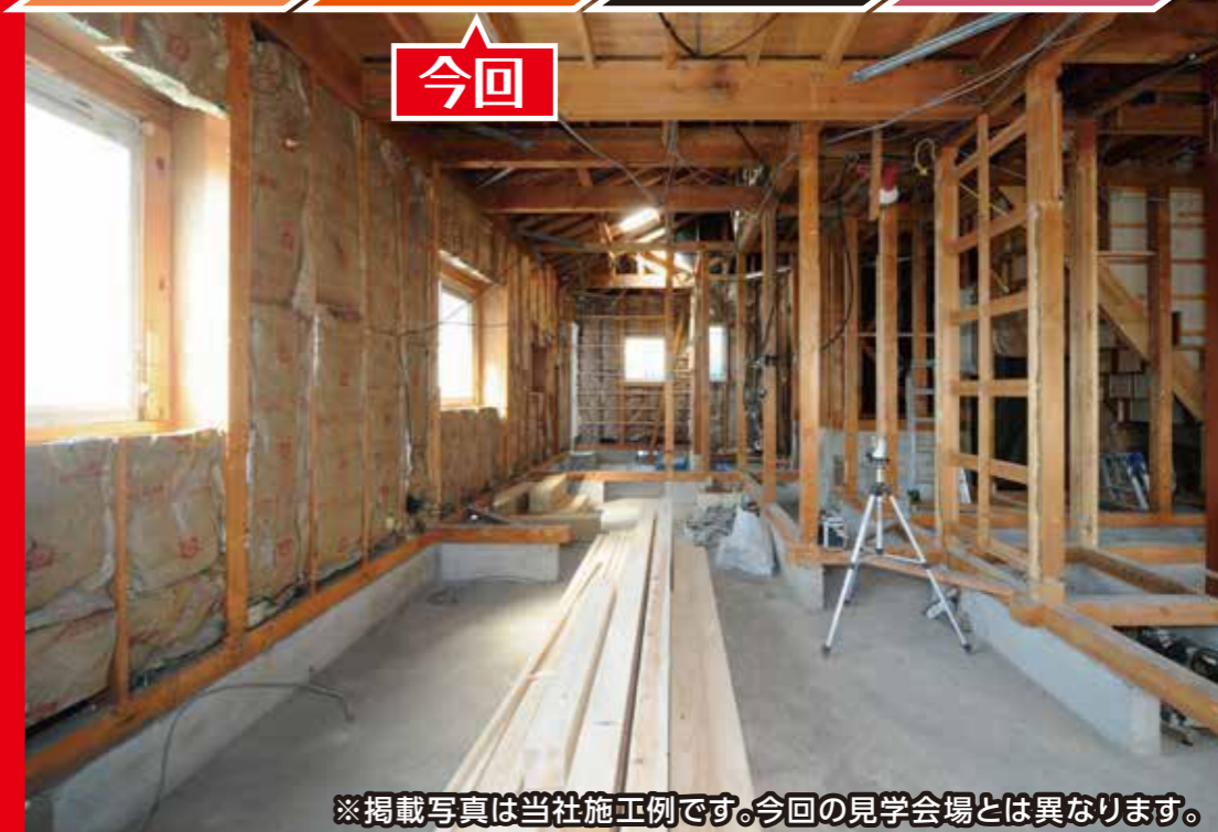
※掲載写真は当社施工例です。今回の見学会場とは異なります。