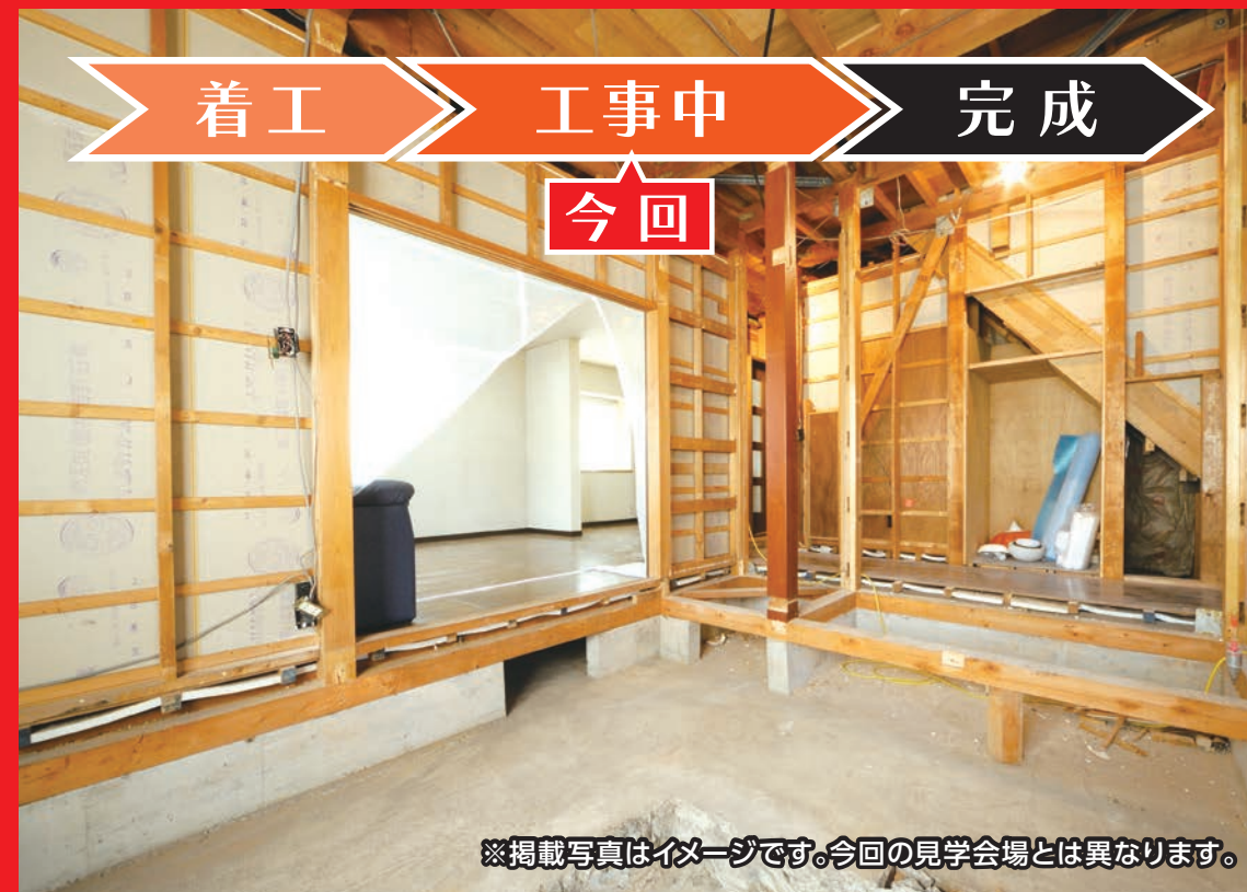
※掲載写真はイメージです。今回の見学会場とは異なります。