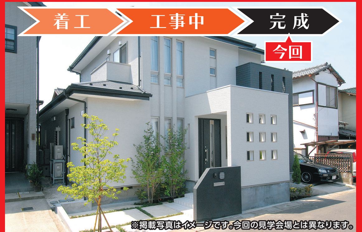
※掲載写真はイメージです。今回の見学会場とは異なります。