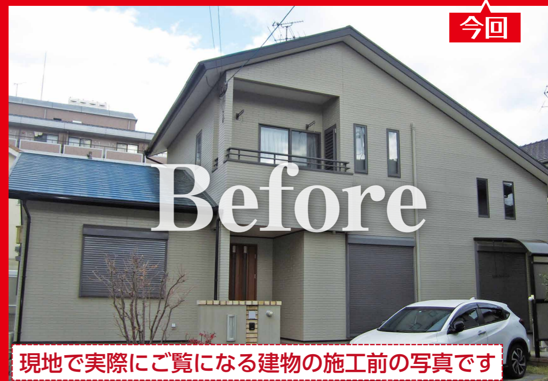
現地で実際にご覧になる建物の施工前の写真です