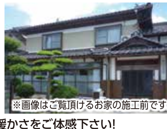
※画像はご覧頂けるお家の施工前です。