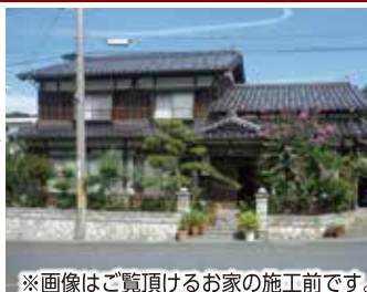
※画像はご覧頂けるお家の施工前です。