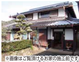
※画像はご覧頂けるお家の施工前です。