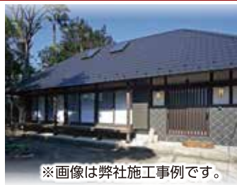
※画像は弊社施工事例です。