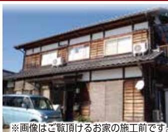
※画像はご覧頂けるお家の施工前です。