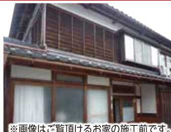
※画像はご覧頂けるお家の施工前です。