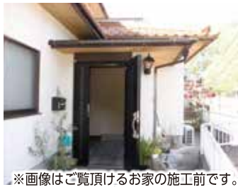
※画像はご覧頂けるお家の施工前です。