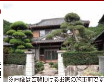
※画像はご覧頂けるお家の施工前です。