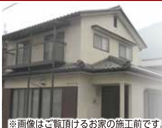
※画像はご覧頂けるお家の施工前です。