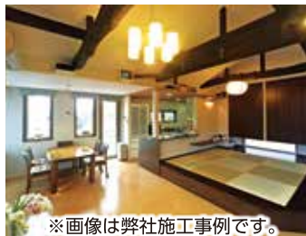
※画像は弊社施工事例です。