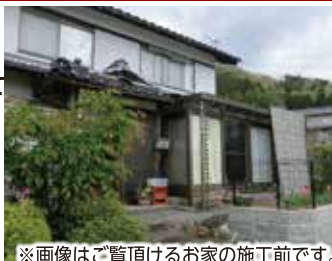
※画像はご覧頂けるお家の施工前です。

住友不動産の新築そっくりさん 北近畿営業所 0120-093-553 FAX 0773-24-8612