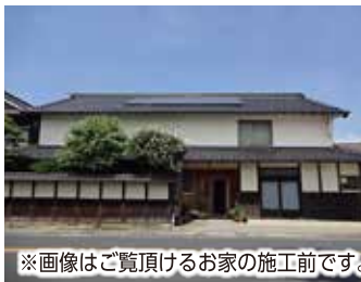
※画像はご覧頂けるお家の施工前です。