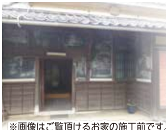
※画像はご覧頂けるお家の施工前です。