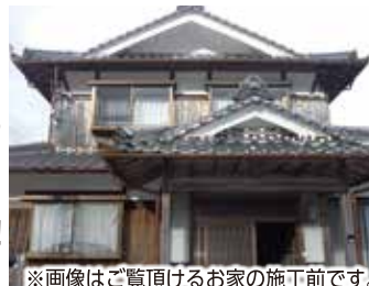
※画像はご覧頂けるお家の施工前です。