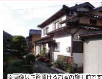
※画像はご覧頂けるお家の施工前です。