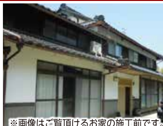
※画像はご覧頂けるお家の施工前です。