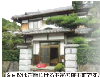
※画像はご覧頂けるお家の施工前です。